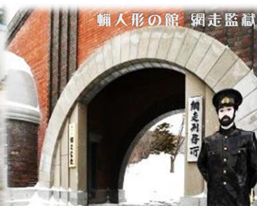
幟人形の館 網走監獄