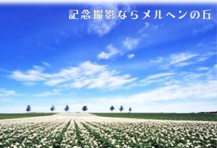
記念撮影ならメルヘンの丘