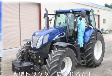
大型トラクターに乗れるかも…