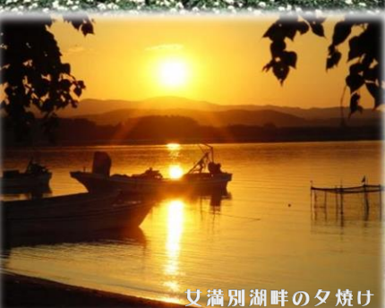
女満別湖畔の夕焼け