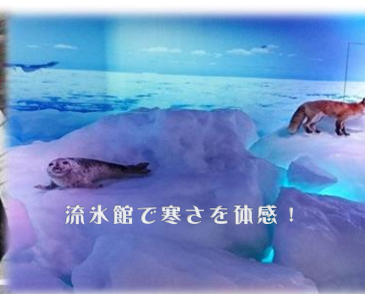
流氷館で寒さを体感！