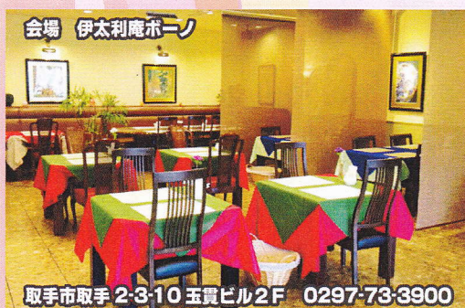
取手市取手 2-3-10 玉貫ビル2F 0297-73-3900